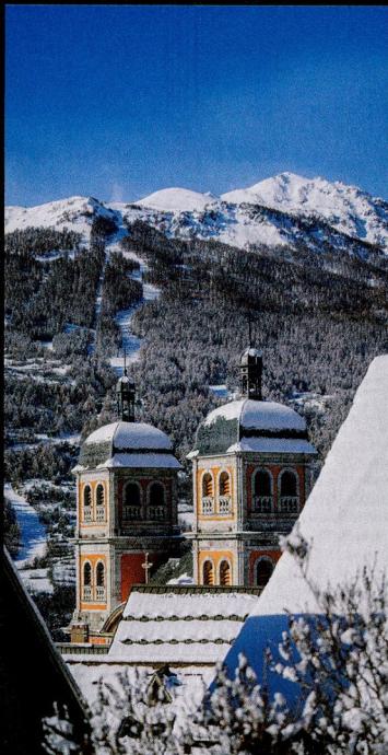
Een kabelbaan vanuit Briançon brengt je direct in het skigebied. Voor als je een dag niet wil skiën, is een bezoek aan de stad en zijn vestingwerken zeer de moeite waard.