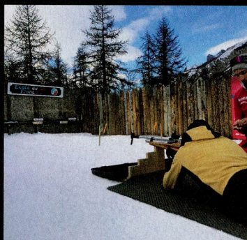
Bij een lesje biathlon leer je - met vallen en opstaan - de beginselen van 'skaten', een speciale pas van het langlaufen. Waarna je vervolgens met een luchtdrukgeweer de roos moet zien te raken.